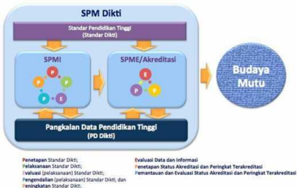
Gambar 1. Penjaminan Mutu Perguruan Tinggi secara Eksternal dan Internal

SPMI dimaksudkan untuk memenuhi atau melampaui SN-Dikti secara berkelanjutan ( continuous improvement ), sebagai upaya memenuhi kebutuhan internal stakeholders (mahasiswa, pendidik, dan tenaga pendidik). Karena itu, SPMI merupakan sub-sistem pertanggungjawaban horisontal internal ( internal horizontal accountability ).