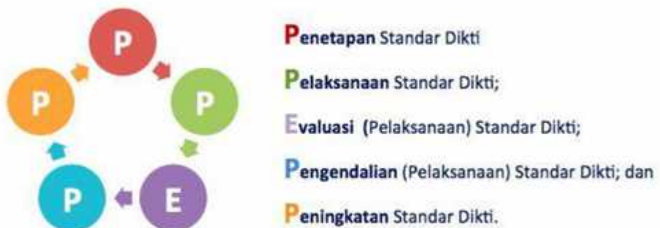
Gambar 1. Siklus SPMI

Mekanisme SPMI UNJ diawali dengan mengimplementasikan SPMI melalui siklus kegiatan yang disingkat sebagai PPEPP , yaitu terdiri atas: