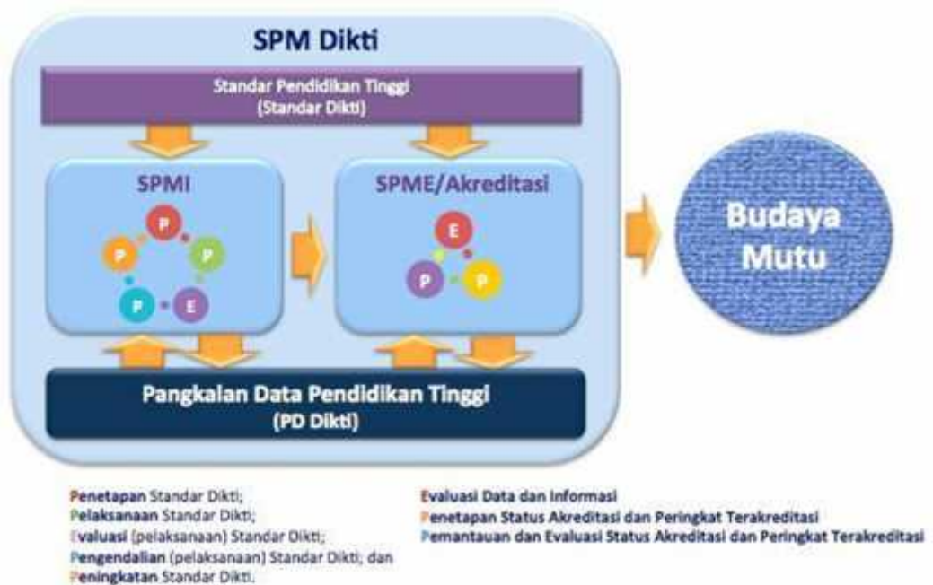
Gambar 1. Penjaminan Mutu Perguruan Tinggi secara Eksternal dan Internal

SPMI dimaksudkan untuk memenuhi atau melampaui SN-Dikti secara berkelanjutan ( continuous improvement ), sebagai upaya memenuhi kebutuhan internal stakeholders (mahasiswa, pendidik, dan tenaga pendidik). Karena itu, SPMI merupakan sub-sistem pertanggungjawaban horisontal internal ( internal horizontal accountability ).